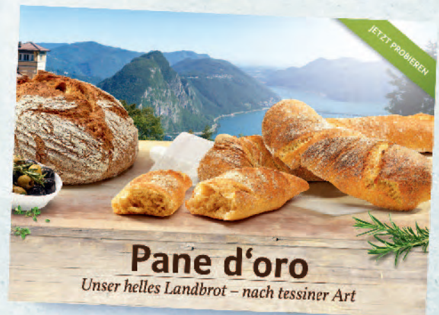
Deckenhänger DIN A3