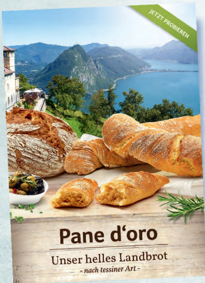
Plakate DIN A1/A2/A3